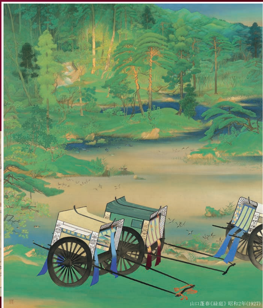
山口蓬春《緑庭》昭和2年(1927)