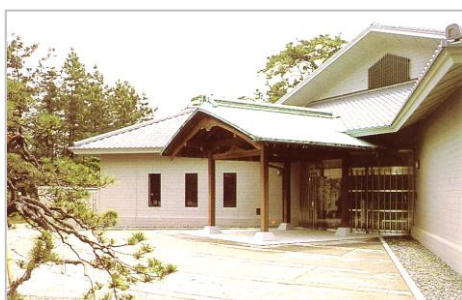
葉山しおさい博物館