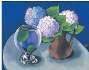
《まり藻と花》昭和30年 山口蓬春記念館蔵 [前期のみ]