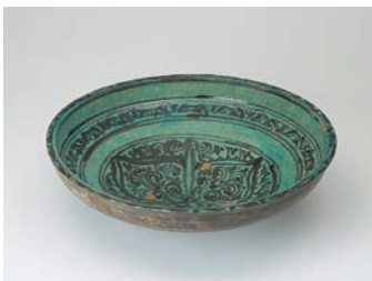
《エジプト緑釉唐草文大鉢》 エジプト 13世紀 山口蓬春記念館蔵 [後期のみ]