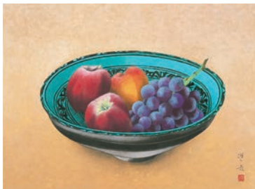
《静物》昭和33年 公益財団法人 水野美術館蔵 [後期のみ]