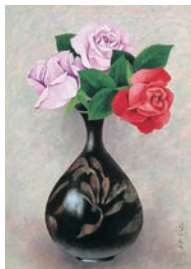
《瓶花》昭和40年 山口蓬春記念館蔵 [前期のみ]