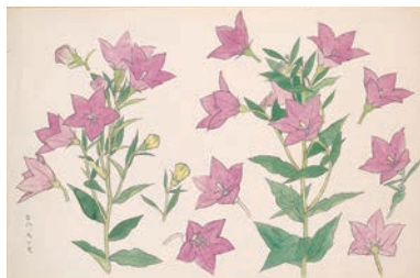
《桔梗 写生》昭和38年 山口蓬春記念館蔵 [後期のみ]