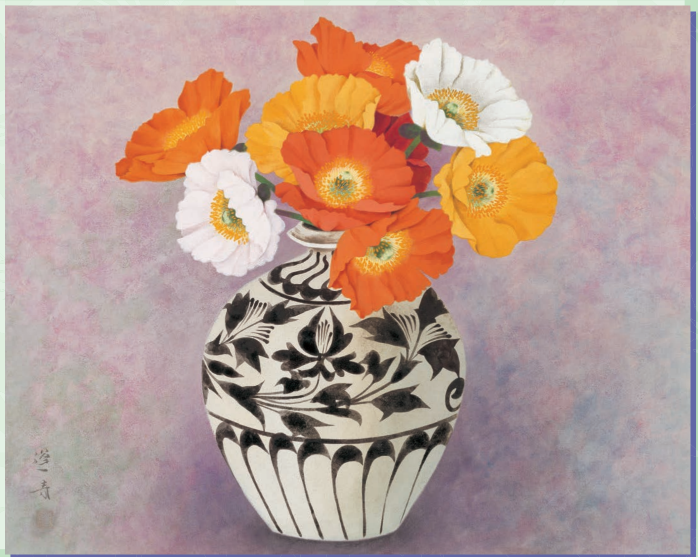
《瓶花》昭和40年 北澤美術館蔵 [前期のみ]