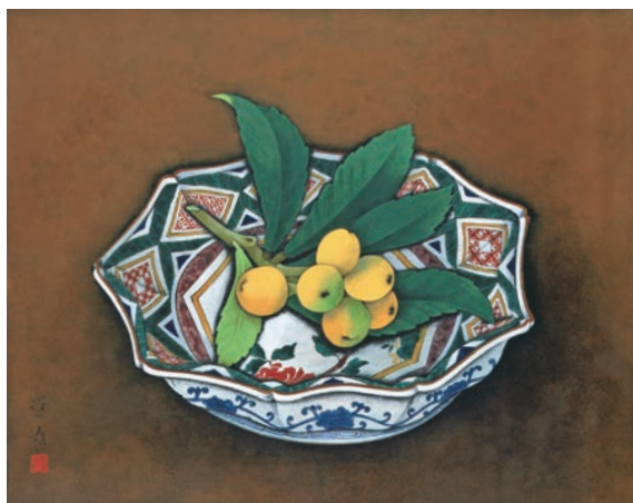
《枇杷》昭和31年 山口蓬春記念館蔵 [前期のみ]