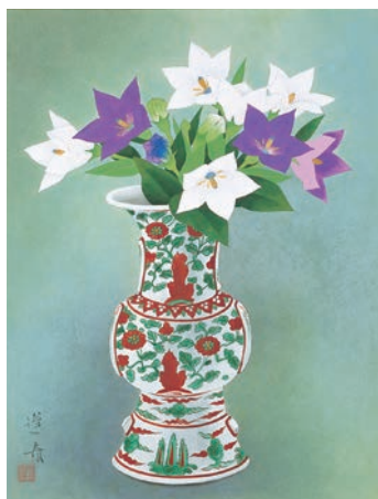
《瓶花》昭和45年 北澤美術館蔵 [後期のみ]