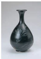
《黒釉鉄絵玉壺春瓶》 中国・磁州窯 宋-金時代 山口蓬春記念館蔵 [前期のみ]

※会期中、一部展示替えを予定しております。 ※展示作品は都合により一部変更することがあります。