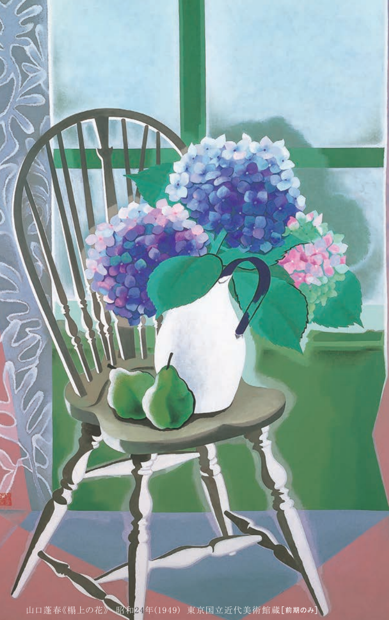
山口蓬春《榻上の花》 昭和24年(1949) 東京国立近代美術館蔵[前期のみ]