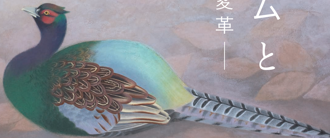
山口蓬春《霜》(部分) 昭和35年(1960) 個人蔵