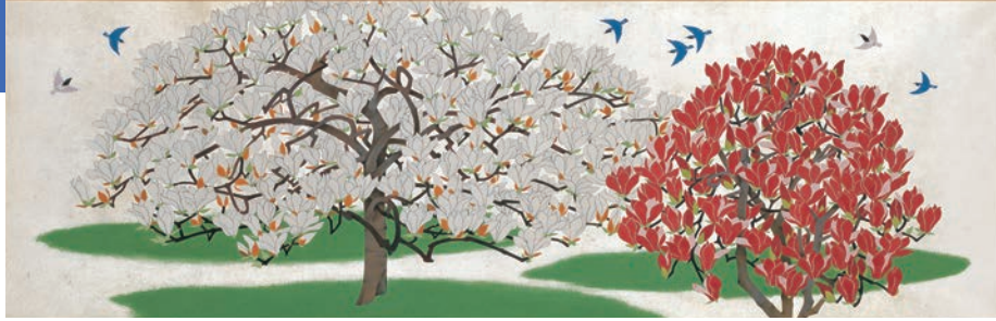
山口蓬春《白蓮木蓮》 昭和32年(1957) 山口蓬春記念館蔵