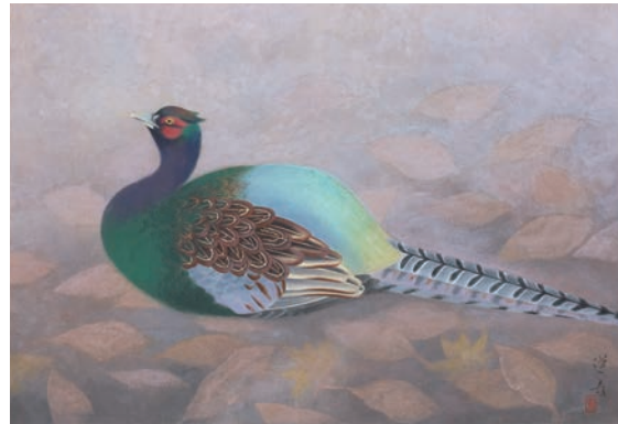
山口蓬春《霜》 昭和35年(1960) 個人蔵