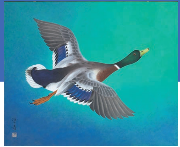
山口蓬春《飛鴨図》 昭和42年(1967) 個人蔵

山口蓬春(1893-1971)は、東京美術学校日本画科を卒業後、伝統的な技法を基盤としつつ古今東西の芸術を吸収し、新しい日本画の創造に邁進していきます。