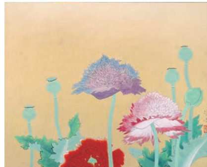
山口蓬春《計志》 昭和25年(1950) 山口蓬春記念館蔵