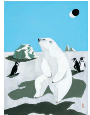
山口蓬春《望郷 小下絵》 昭和28年(1953) 山口蓬春記念館蔵