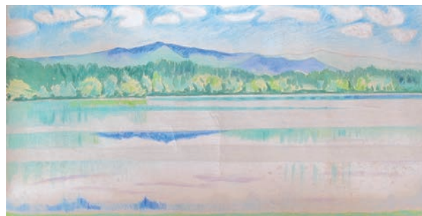
山口蓬春《山湖 小下絵》 昭和22年(1947) 山口蓬春記念館蔵