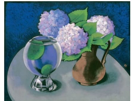
山口蓬春《まり藻と花》 昭和30年(1955) 山口蓬春記念館蔵