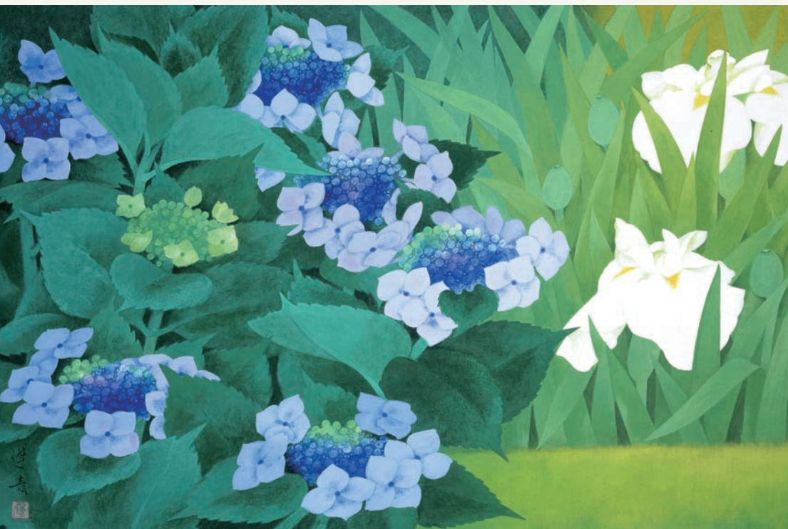
山口蓬春《夏影》昭和38年(1963)〔後期のみ〕

令和8年 前期:1月31日(土)～3月1日(日) / 後期:3月3日(火)～3月29日(日) 1/31 土 — 3/29 日