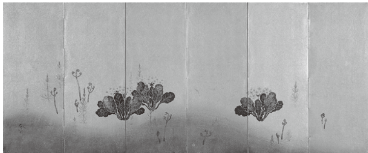
《櫻草之圖》菱田春草筆 明治時代