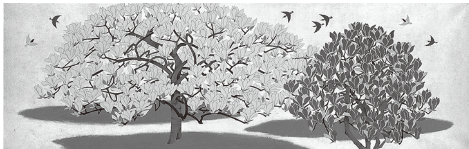
《白蓮木蓮》山口蓬春筆 昭和33年