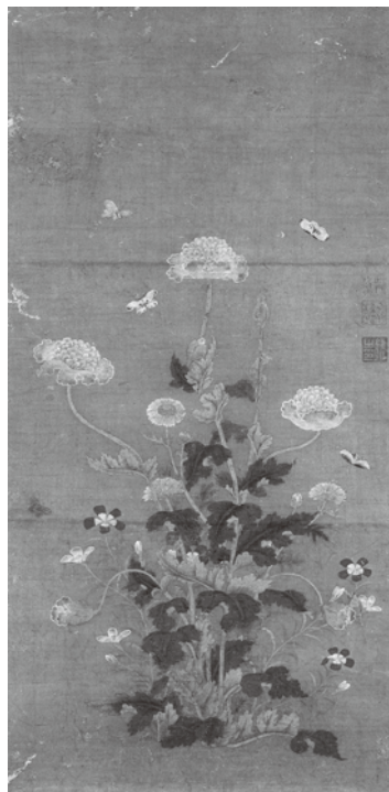
《草蟲図》筆者不詳 江戸時代

春の草花が芽吹き、野鳥が訪れる旧山口邸の閑かな佇まいのなか、蓬春が憧れ慈しんだ花鳥画の世界を堪能していただけましたら幸いです。