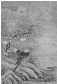
《鶉鳩図》松浦家伝来 伝狩野國松筆 室町時代