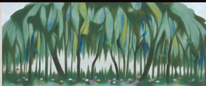
山口蓬春《柱》国立教育会館緞帳原画 昭和39年(1964) 独立行政法人教員研修センター蔵

開館時間: 午前10時～午後5時(入館は午後4時30分まで) 休館日: 毎週月曜日(9月15日、10月13日は除く)、9月16日、10月14日