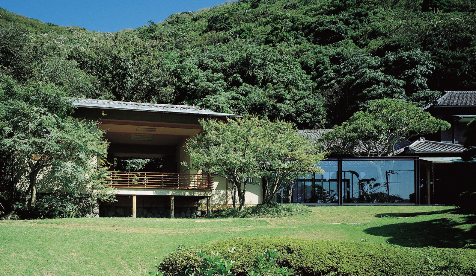
山口蓬春記念館外観

平成26年 8月22日(金) — 10月19日(日) 前期: 8月22日(金) — 9月15日(月・祝) 後期: 9月17日(水) — 10月19日(日)