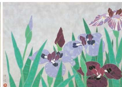
山口蓬春《首夏の花》昭和27年(1952) 葉山町蔵