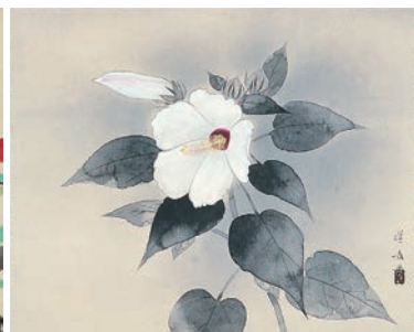
山口蓬春《芙蓉》昭和15年(1940)頃 葉山町蔵