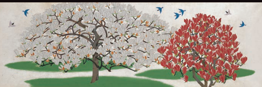
山口蓬春《白蓮木蓮》新橋演舞場緞帳原画 昭和32年(1957) 山口蓬春記念館蔵

平成26年 8月22日(金) — 10月19日(日) 前期: 8月22日(金) — 9月15日(月・祝) 後期: 9月17日(水) — 10月19日(日)