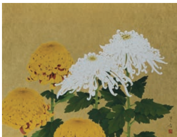
山口蓬春《菊》昭和34年(1959) 株式会社明治座蔵