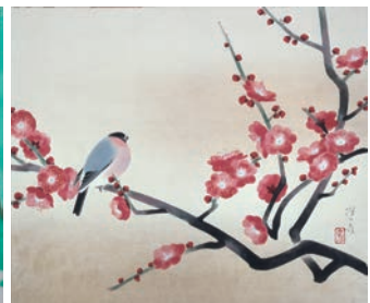
山口蓬春《紅梅》昭和30年(1955) 五島美術館蔵[前期のみ] 名鏡勝朗 撮影