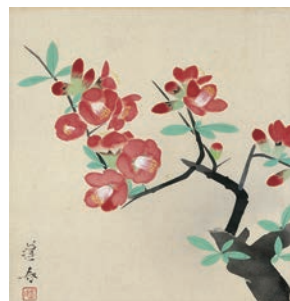
山口蓬春《木瓜》昭和14年(1939)頃 五島美術館蔵[前期のみ]

※会期中、一部展示替えを行います。展示作品は都合により一部変更することがあります。