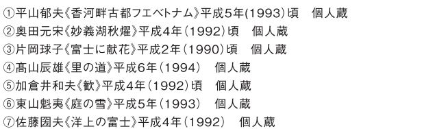
⑤ 加倉井和夫《歎》平成4年(1992)頃 個人蔵