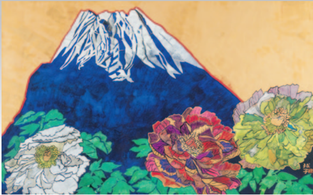
③ 片岡球子《富士に献花》平成2年(1990)頃 個人蔵