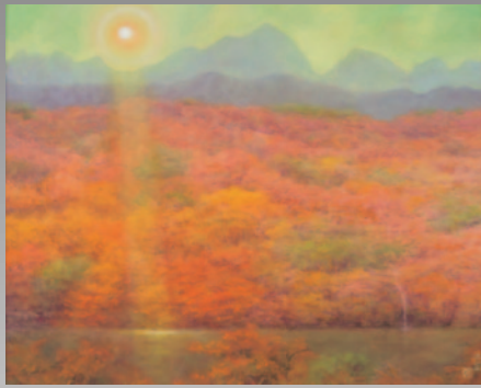
② 奥田元宋《妙義湖秋輝》平成4年(1992)頃 個人蔵