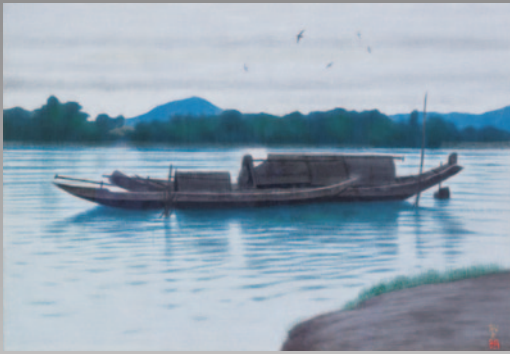
① 平山郁夫《香河畔古都フエトナム》平成5年(1993)頃 個人蔵