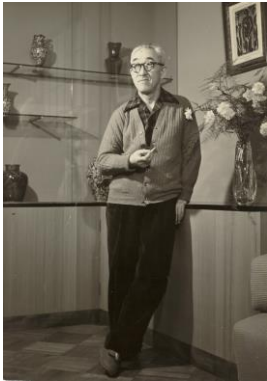
画室にたたずむ蓬春

来館された方には、蓬春の生前の創作活動を偲んでいただくとともに、葉山の自然を満喫していただけます。