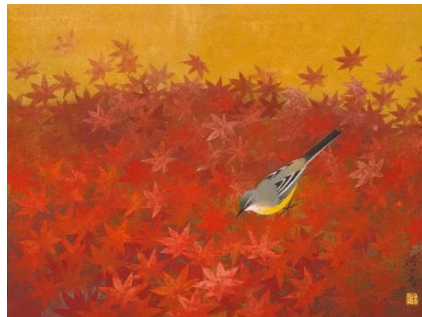
山口蓬春《新冬》昭和37年 山口蓬春記念館蔵