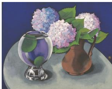
山口蓬春《まり藻と花》昭和30年(1955)