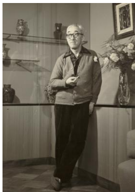
画室にたたずむ蓬春

来館された方には、蓬春の生前の創作活動を偲んでいただくとともに、葉山の自然を満喫していただけます。