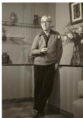
画室にたたずむ蓬春

来館された方には、蓬春の生前の創作活動を偲んでいただくとともに、葉山の自然を満喫していただけます。